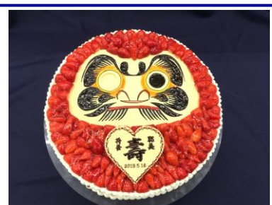
世界にひとつだけの オリジナルケーキ

※ウェディングケーキは、基本のスクウェアに加え、段デコレーションやオリジナルデザインも可能です。人数や大きさ、内容に応じて料金が変わります。