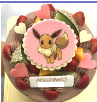
イラスト、写真入りケーキ

クレームダイヤモンドをぎっしり詰めたタルト生地に、あんずをふんだんに飾り、じっくりと焼き上げました。