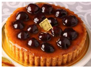
チェリーのタルト

三角形の形がとても可愛らしいフランス語で、「家」を意味する、お子様に大人気のケーキです。チョコレートスポンジにバタークリームをサンドし、表面をカールチョコレートでデコレーションしました。